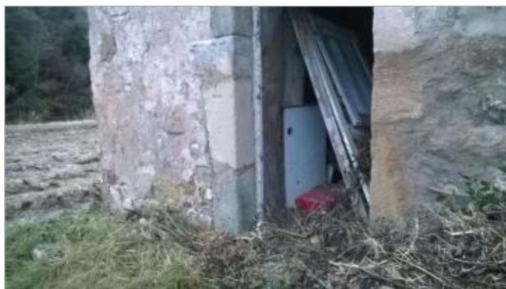
Repère Maison Millepeys