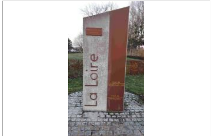
Vue du site en 2020