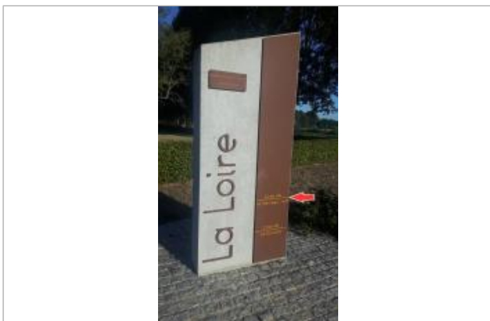
Repère en 2019

Texte : Crue du 10/08/1943 - 10h Maximum de l'inondation : Oui Visibilité : Oui État du repère : Bon Pérennité : Longue