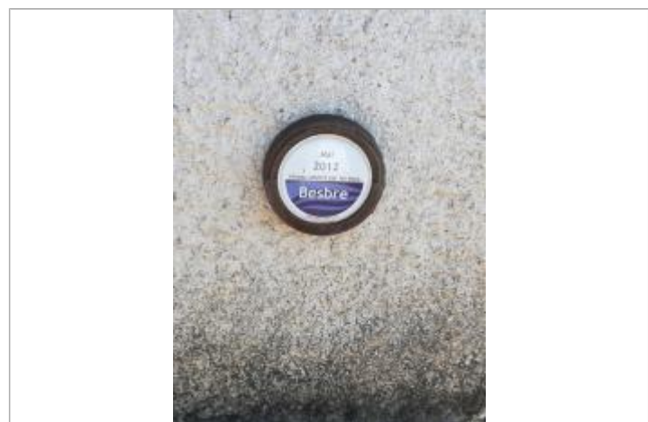
Macaron EP Loire