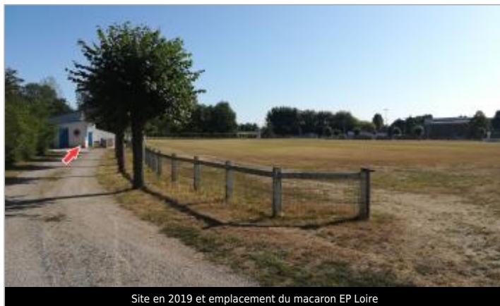
Site en 2019 et emplacement du macaron EP Loire