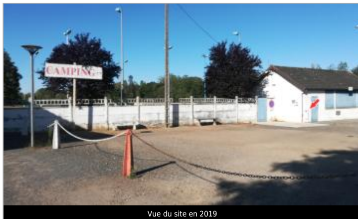
Vue du site en 2019