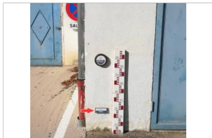
Repère de 2012 en 2019