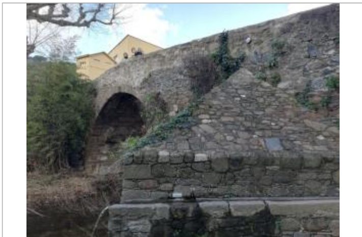
Square Pont Vieux

Texte : REAL COLLOBRIER Maximum de l'inondation : Non renseigné Visibilité : Oui