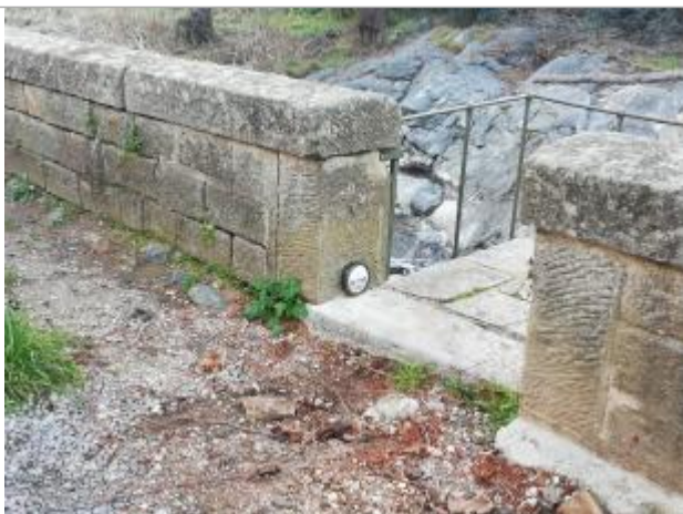
Accès Réal Collobrier