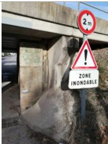
Passage sous voie ferrée