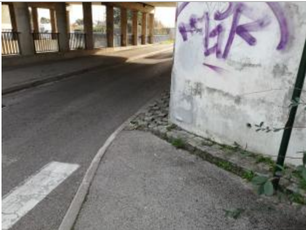
Passage sous autoroute