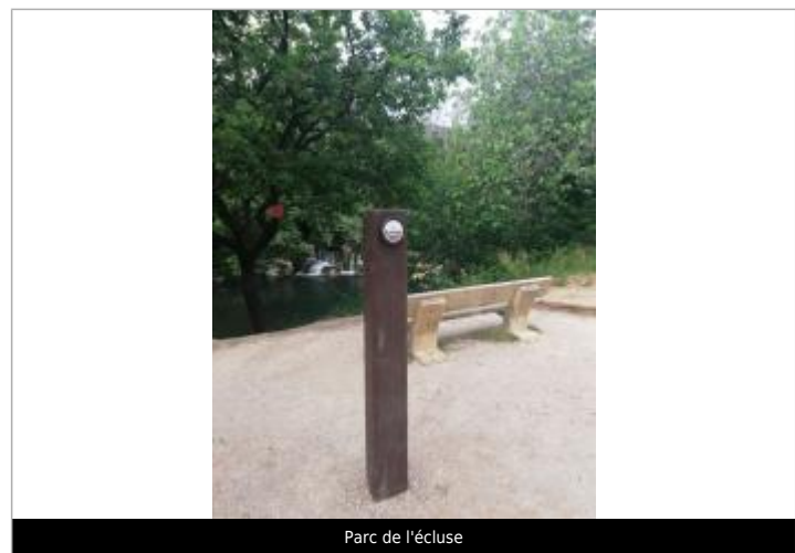
Parc de l'écluse