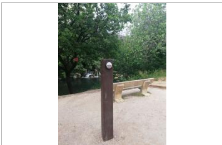
Parc de l'écluse

Texte : Gapeau Maximum de l'inondation : Oui Visibilité : Oui