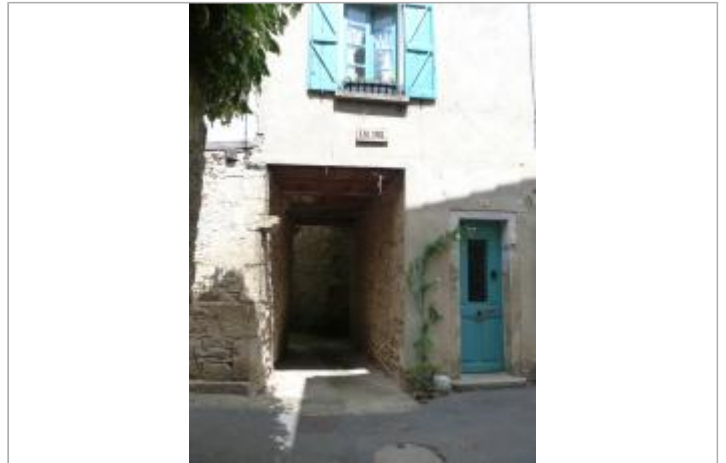
au niveau d'un passage entre deux maisons, à côté du 11 rue des Claustres