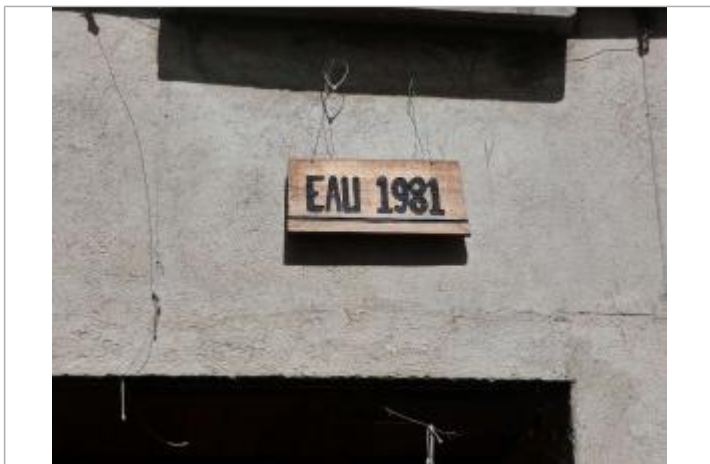
plaque en bois gravée tenue par des fils métalliques