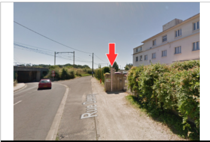
Vue du site en 2018

GÉOLOCALISATION Coordonnées WGS84 : X: 1.92601366 / Y: 47.88364640 Coordonnées RGF93 (Lambert 93) X: 619729.17 / Y: 6754240.59 Coordonnées RGF93 (ETRS89) : X: 1.9260137 / Y: 47.8836464 Code Hydro: ----0000 Rive de référence: Gauche