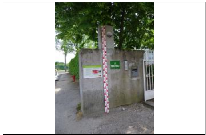
Vue du repère en 2011, source : département du Loiret.

MARQUE Maximum de l'inondation : Oui Visibilité : Oui État du repère : Bon Pérennité : Longue