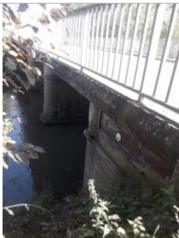
Amont pont RD32