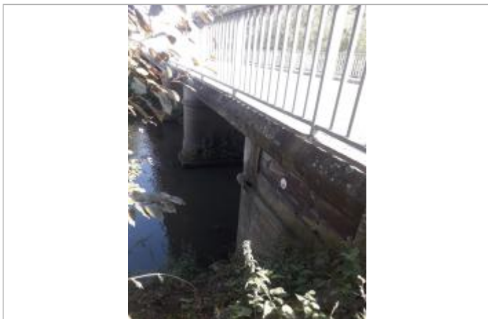
Amont pont RD32