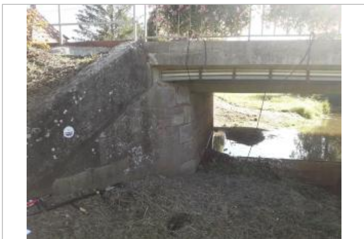
Pont Waldgraben RD263

Code : BR6 Date de mise à jour : 12/08/2019 Auteur : SDEA