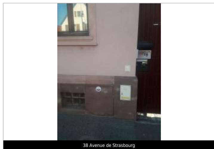
38 Avenue de Strasbourg