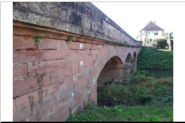
Nivellement réalisé par un géomètre expert

GÉOLOCALISATION Coordonnées WGS84 : X: 7.40264280 / Y: 48.80325200 Coordonnées RGF93 (Lambert 93) X: 1023201.6 / Y: 6864920.97 Coordonnées RGF93 (ETRS89) : X: 7.4026428 / Y: 48.803252 Code Hydro: A34-0210 Rive de référence: