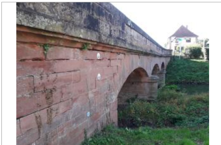
Nivellement réalisé par un géomètre expert