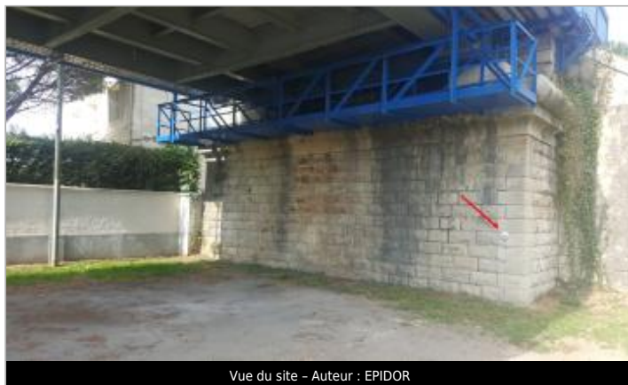
Vue du site - Auteur : EPIDOR