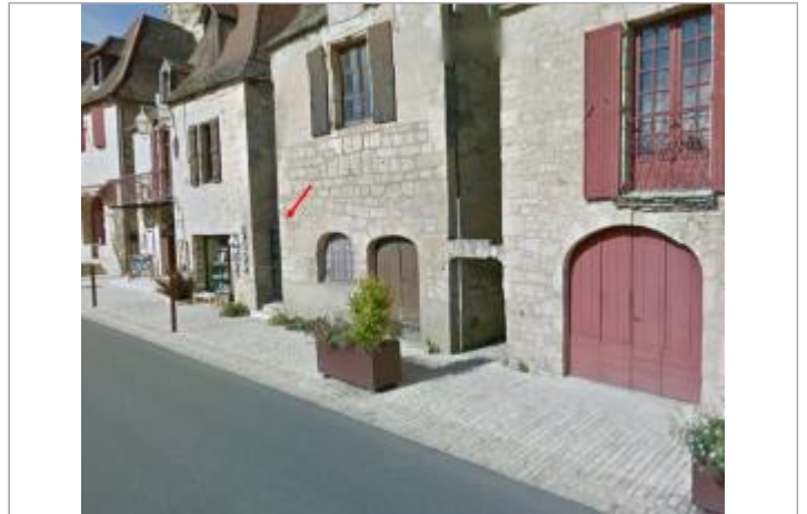
Maison Roque Gageac