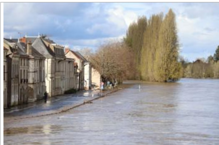
Vue de l'inondation Quai Alsace Lorraine

Organisme(s) : SPC Vienne - Charente - Atlantique