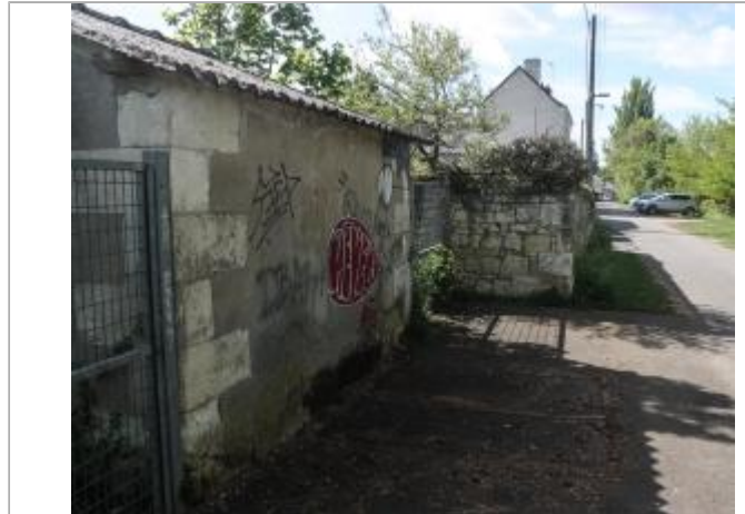
Bâtiment au 74 allée Percevault (1)

Coordonnées WGS84 : X: 0.53640027 / Y: 46.80918900