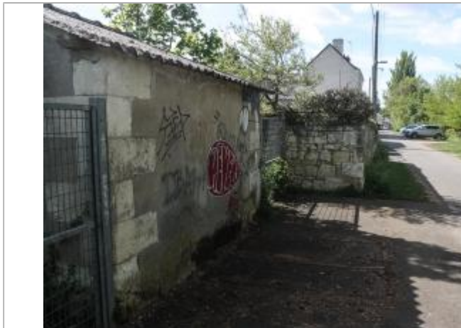
Bâtiment au 74 allée Percevault (1)