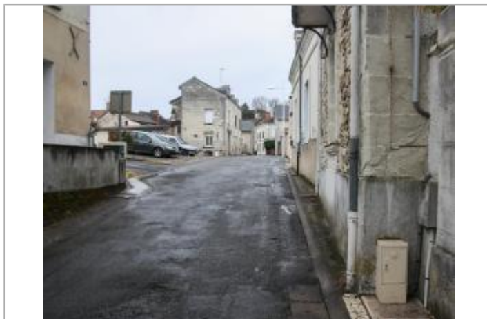
Site 2 rue d'Artois