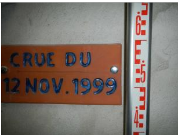
Vue du repère 2

Altitude calculée de l'eau (en m) : 107.68 m