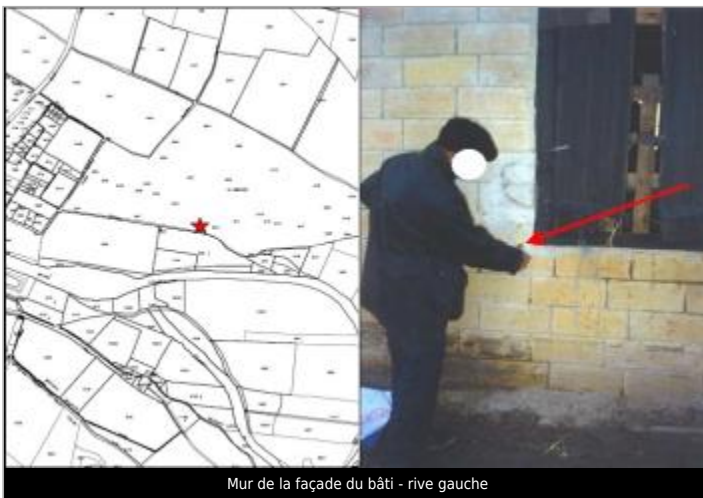
Mur de la façade du bâti - rive gauche

GÉOLOCALISATION Coordonnées WGS84 : X: 2.57431780 / Y: 43.29223700 Coordonnées RGF93 (Lambert 93) X: 665433.77 / Y: 6243767.33 Coordonnées RGF93 (ETRS89) : X: 2.5743178 / Y: 43.292237 Code Hydro: Y1430540 Rive de référence: Gauche