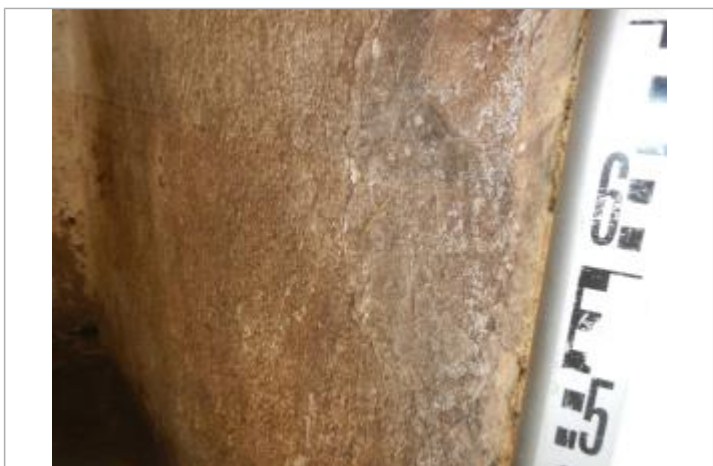
Vue du repère 2

GÉNÉRAL Code : AUDE18_R_985_1 Date de mise à jour : 25/07/2019 Auteur : SPC MO