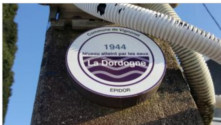
Vue du repère - Auteur : EPIDOR

Maximum de l'inondation : Oui Visibilité : Oui État du repère : Bon Pérennité : Longue Repère calculé : Non renseigné PHEC : Non renseigné