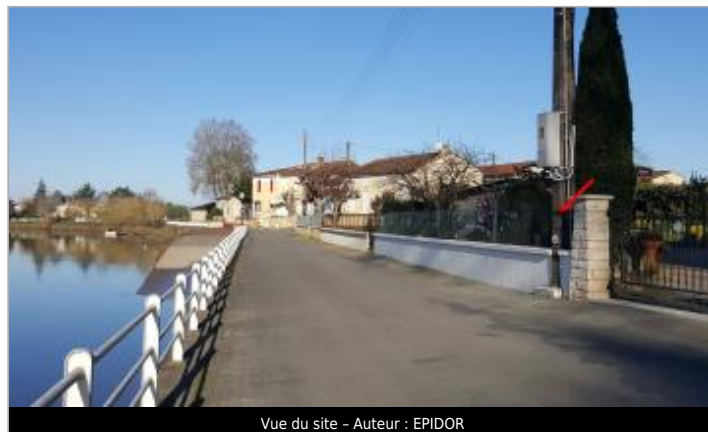
Vue du site - Auteur : EPIDOR