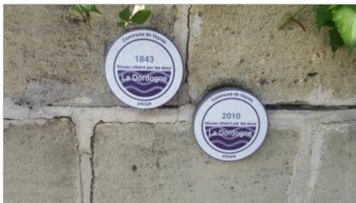
Vue du repère - Auteur : EPIDOR