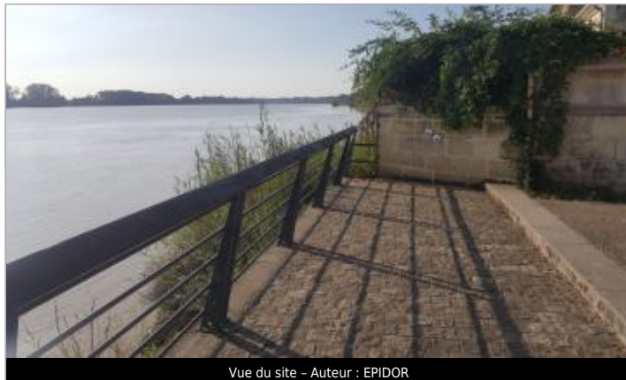
Vue du site - Auteur : EPIDOR

Coordonnées WGS84 : X: -0.31960660 / Y: 44.91021130