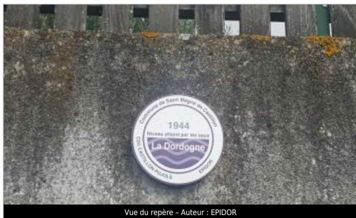
Vue du repère - Auteur : EPIDOR