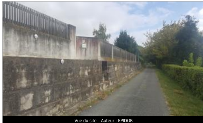
Vue du site - Auteur : EPIDOR

Coordonnées WGS84 : X: -0.07615900 / Y: 44.83635380