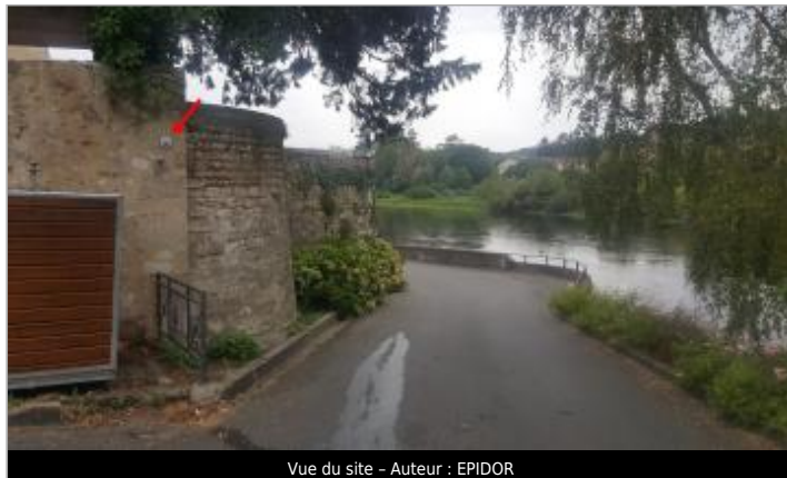
Vue du site - Auteur : EPIDOR

Coordonnées WGS84 : X: 0.21856050 / Y: 44.84337810