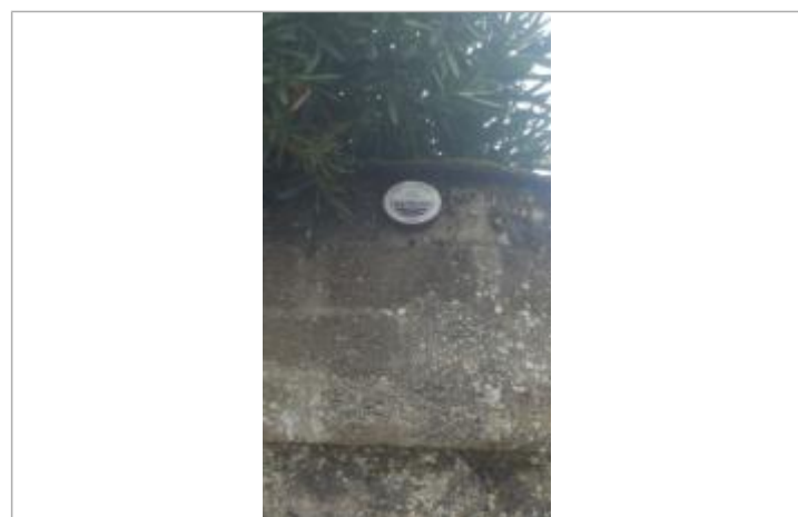
Vue du repère - Auteur : EPIDOR

GÉNÉRAL Code : EPIDOR_R_33402-2_1 Date de mise à jour : 25/04/2022 Auteur : M. Thomas - EPIDOR