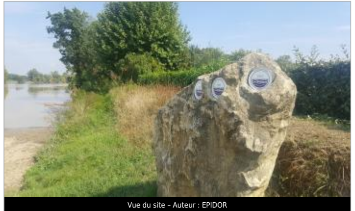
Vue du site - Auteur : EPIDOR