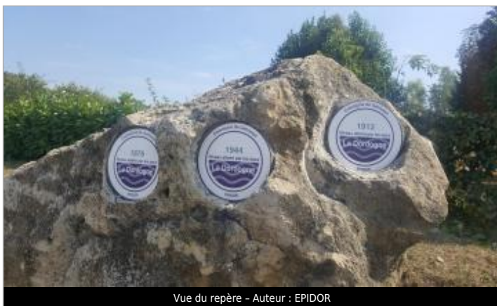
Vue du repère - Auteur : EPIDOR

SOURCE DE REPÉRAGE : RECENSEMENT DE REPÈRES DE CRUES DE L'ÉTABLISSEMENT PUBLIC TERRITORIAL DU BASSIN DE LA DORDOGNE - 29/03/2019