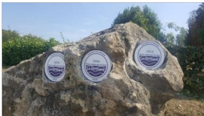
Vue du repère - Auteur : EPIDOR