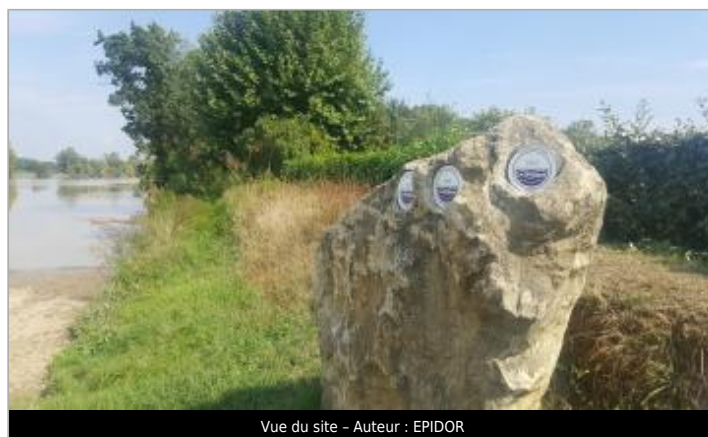
Vue du site - Auteur : EPIDOR

GÉOLOCALISATION Coordonnées WGS84 : X: -0.24467840 / Y: 44.87368710 Coordonnées RGF93 (Lambert 93) X: 443817 / Y: 6424654 Coordonnées RGF93 (ETRS89) : X: -0.2446784 / Y: 44.8736871 Code Hydro: P---0000 Rive de référence: Non renseigné