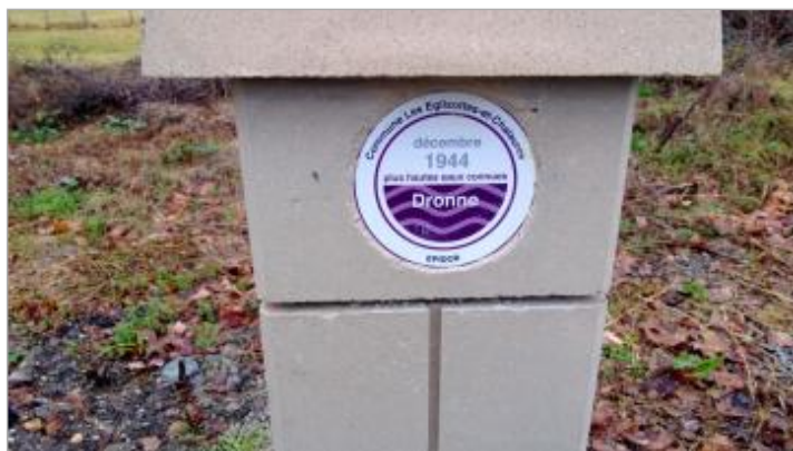
Vue du repère - Auteur : EPIDOR

Maximum de l'inondation : Oui Visibilité : Oui État du repère : Bon Pérennité : Longue Repère calculé : Non renseigné PHEC : Non renseigné