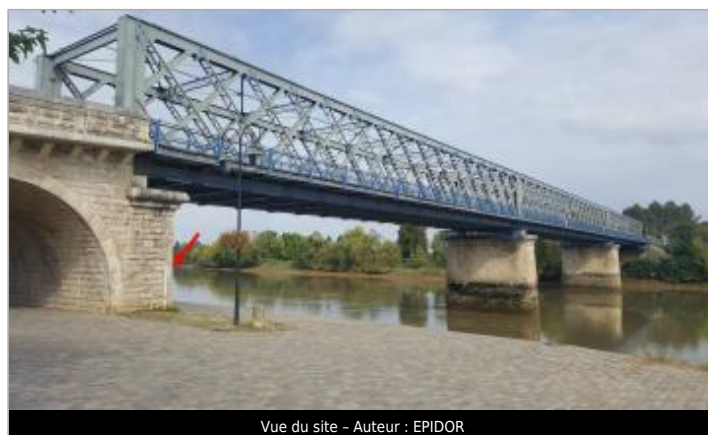
Vue du site - Auteur : EPIDOR