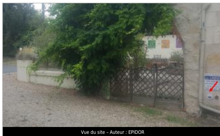
Vue du site - Auteur : EPIDOR