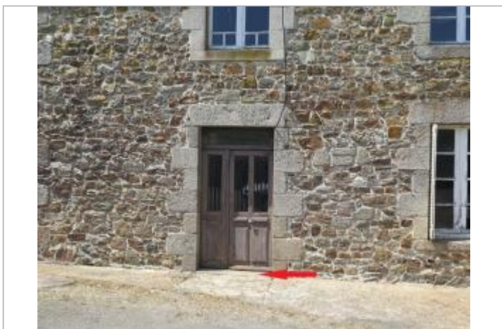
Photographie du repère ( 17/07/2019)

GÉNÉRAL Code : SPC VCB 22350-009a Date de mise à jour : 22/07/2019 Auteur : SPC VCB