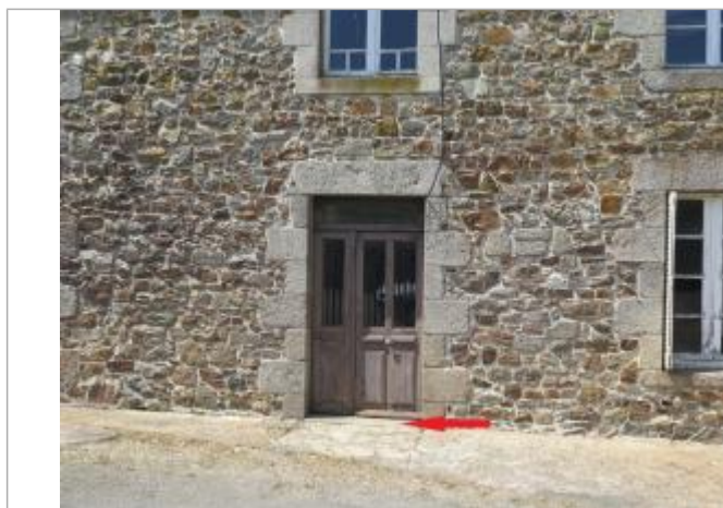
Photographie du repère ( 17/07/2019)

Altitude calculée de l'eau (en m) : 59.22