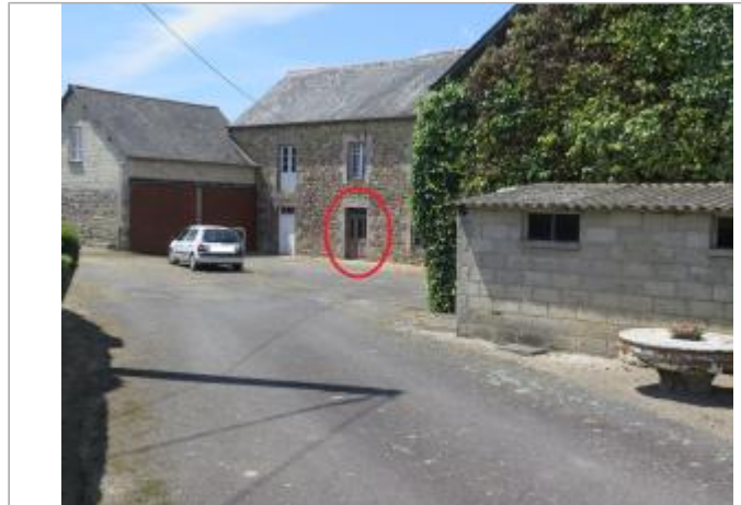
Vue d'ensemble du site ( 17/07/2019)

Coordonnées WGS84 : X: -2.15067580 / Y: 48.26399370