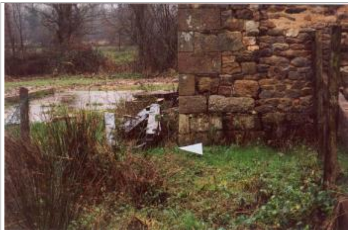
Photographie du repère (19/01/2001)