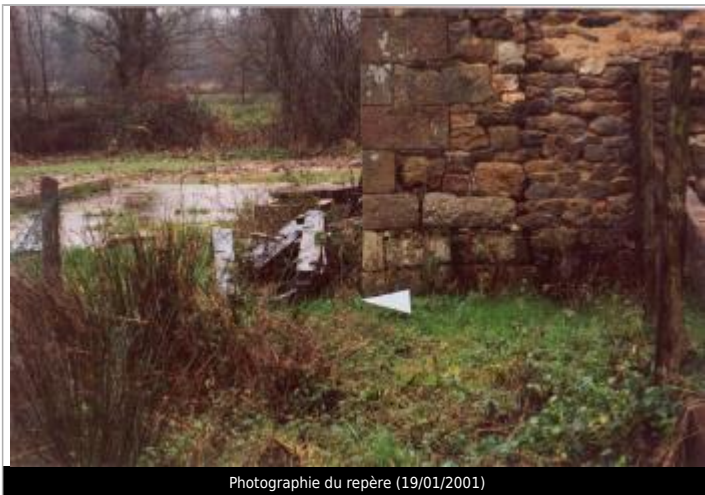
Photographie du repère (19/01/2001)

Altitude calculée de l'eau (en m) : 65.81