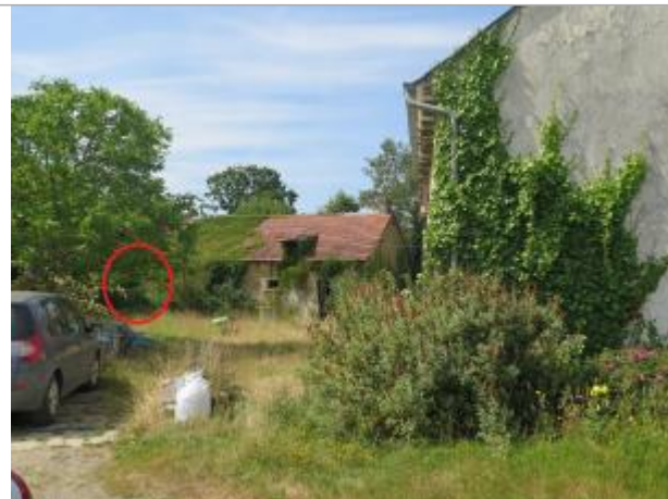
Vue d'ensemble du site ( 17/07/2019)

Coordonnées WGS84 : X: -2.18544300 / Y: 48.24948080