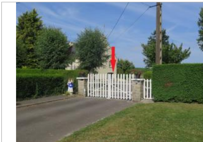
Vue d'ensemble du site ( 17/07/2019)