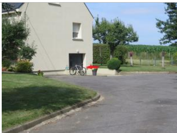
Photographie du repère ( 17/07/2019)

Altitude calculée de l'eau (en m) : 95.66 m