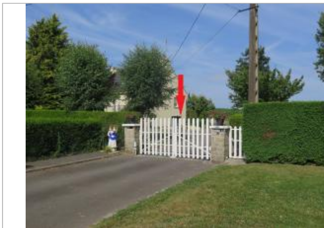
Vue d'ensemble du site ( 17/07/2019)