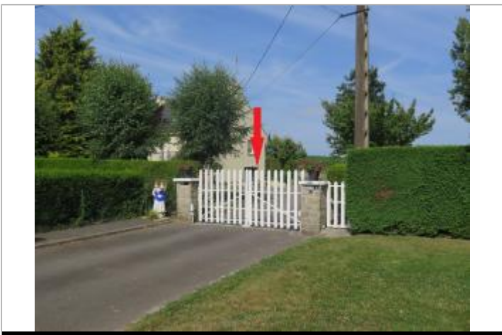
Vue d'ensemble du site ( 17/07/2019)

GÉOLOCALISATION Coordonnées WGS84 : X: -2.29800300 / Y: 48.25418730 Coordonnées RGF93 (Lambert 93) X: 307067.4 / Y: 6808058.78 Coordonnées RGF93 (ETRS89) : X: -2.298003 / Y: 48.2541873 Code Hydro: J0--0160 Rive de référence: Droite