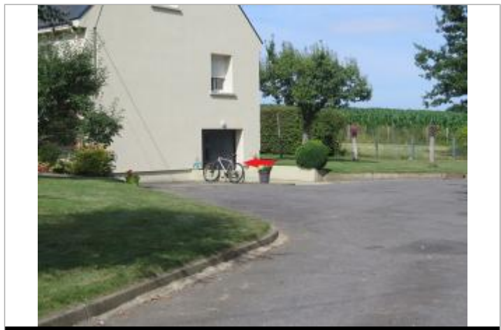
Photographie du repère ( 17/07/2019)

GÉNÉRAL Code : SPC VCB 22250-009a Date de mise à jour : 22/07/2019 Auteur : SPC VCB