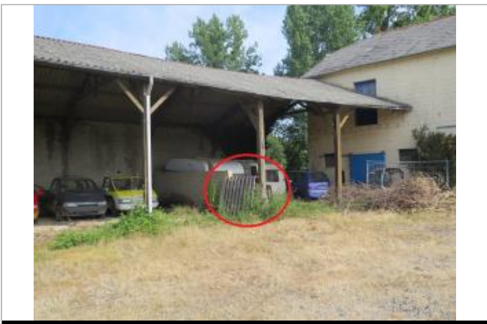
Vue d'ensemble du site ( 17/07/2019)

GÉOLOCALISATION Coordonnées WGS84 : X: -2.29434660 / Y: 48.25338910 Coordonnées RGF93 (Lambert 93) X: 307332.23 / Y: 6807952.08 Coordonnées RGF93 (ETRS89) : X: -2.2943466 / Y: 48.2533891 Code Hydro: J0--0160 Rive de référence: Droite