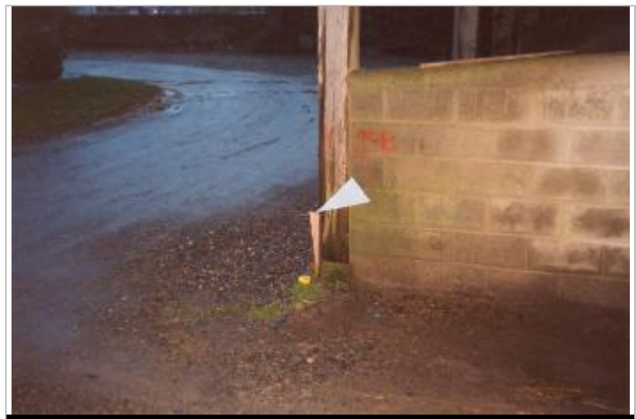
Photographie du repère (19/01/2001)

MARQUE Maximum de l'inondation : Oui Visibilité : Oui État du repère : Disparu Pérennité : Aucune Repère calculé : Non PHEC : Non renseigné