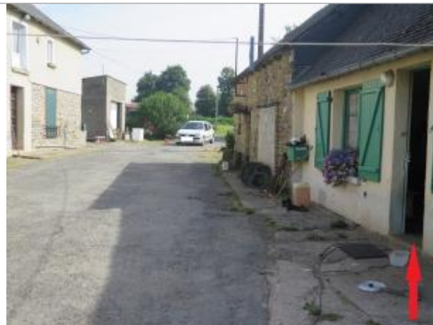
Vue d'ensemble du site ( 17/07/2019)

Coordonnées WGS84 : X: -2.30521080 / Y: 48.25862540