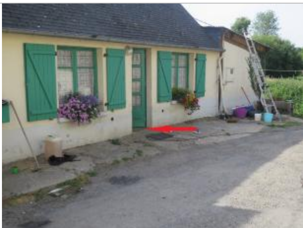
Photographie du repère ( 17/07/2019)

Altitude calculée de l'eau (en m) : 97.15