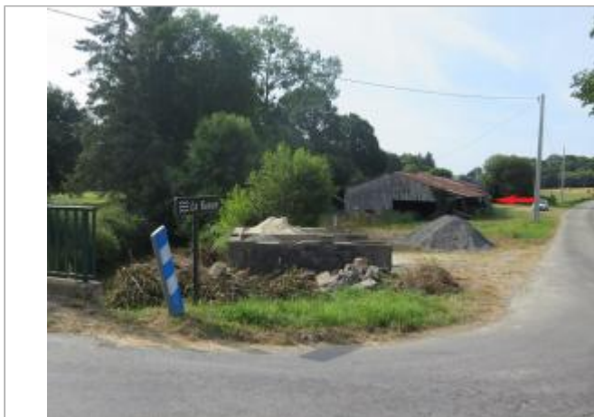
Vue d'ensemble du site ( 17/07/2019)

Coordonnées WGS84 : X: -2.40337830 / Y: 48.25025100