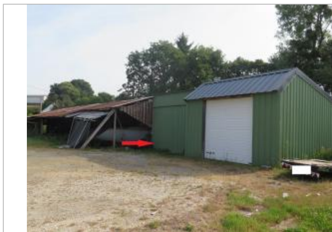
Photographie du repère ( 17/07/2019)