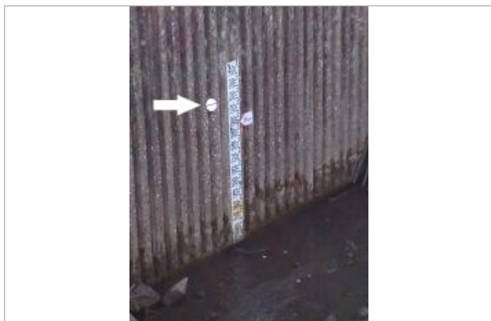
Simulation de pose d'un repère prévu début 2020

Altitude calculée de l'eau (en m) : 95.2 m