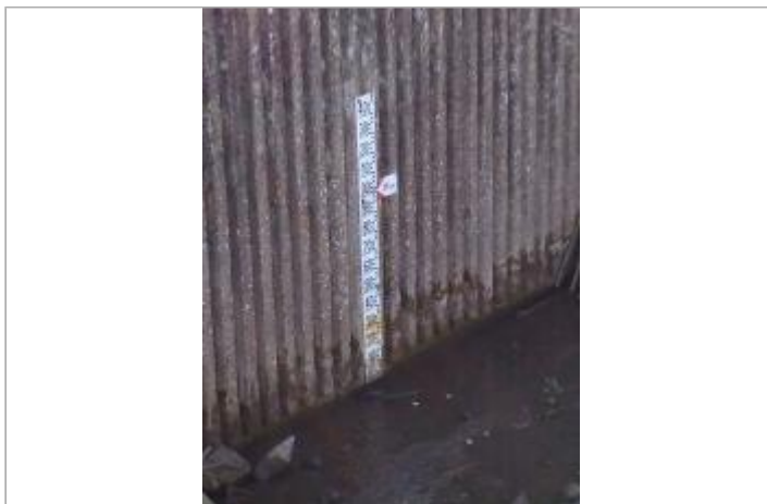
Echelle de sortie du bassin des Près de l'Étang