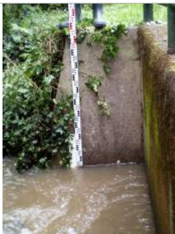
Marque d'humidité sur le mur rive gauche amont.

Altitude calculée de l'eau (en m) : 62.83 m