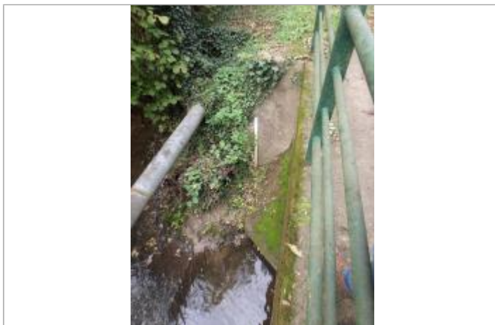
Echelle limnimétrique en rive gauche coté amont