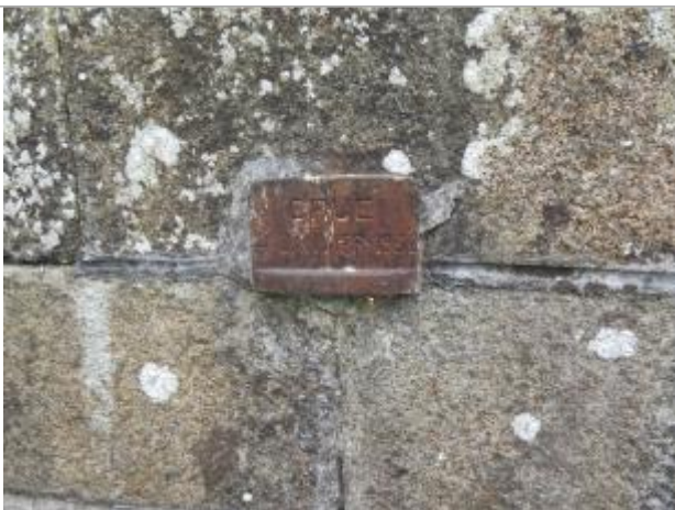
Photographie du repère

Système altimétrique : NGF IGN 1969 (système normal)