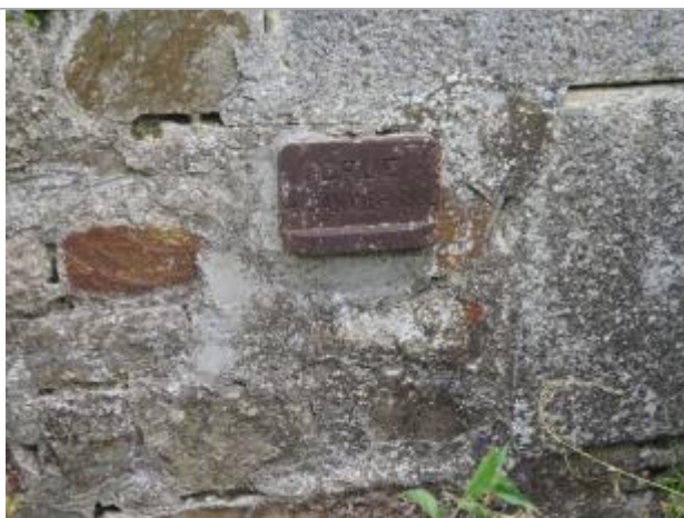
Photographie du repère

Système altimétrique : NGF IGN 1969 (système normal)