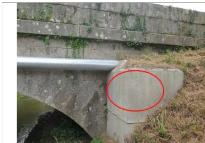
Photographie du repère

Système altimétrique : NGF IGN 1969 (système normal)