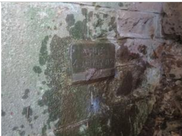
Photographie du repère ( vue zoomée )

Système altimétrique : NGF IGN 1969 (système normal)