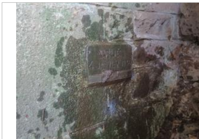
Photographie du repère ( vue zoomée )

Système altimétrique : NGF IGN 1969 (système normal)